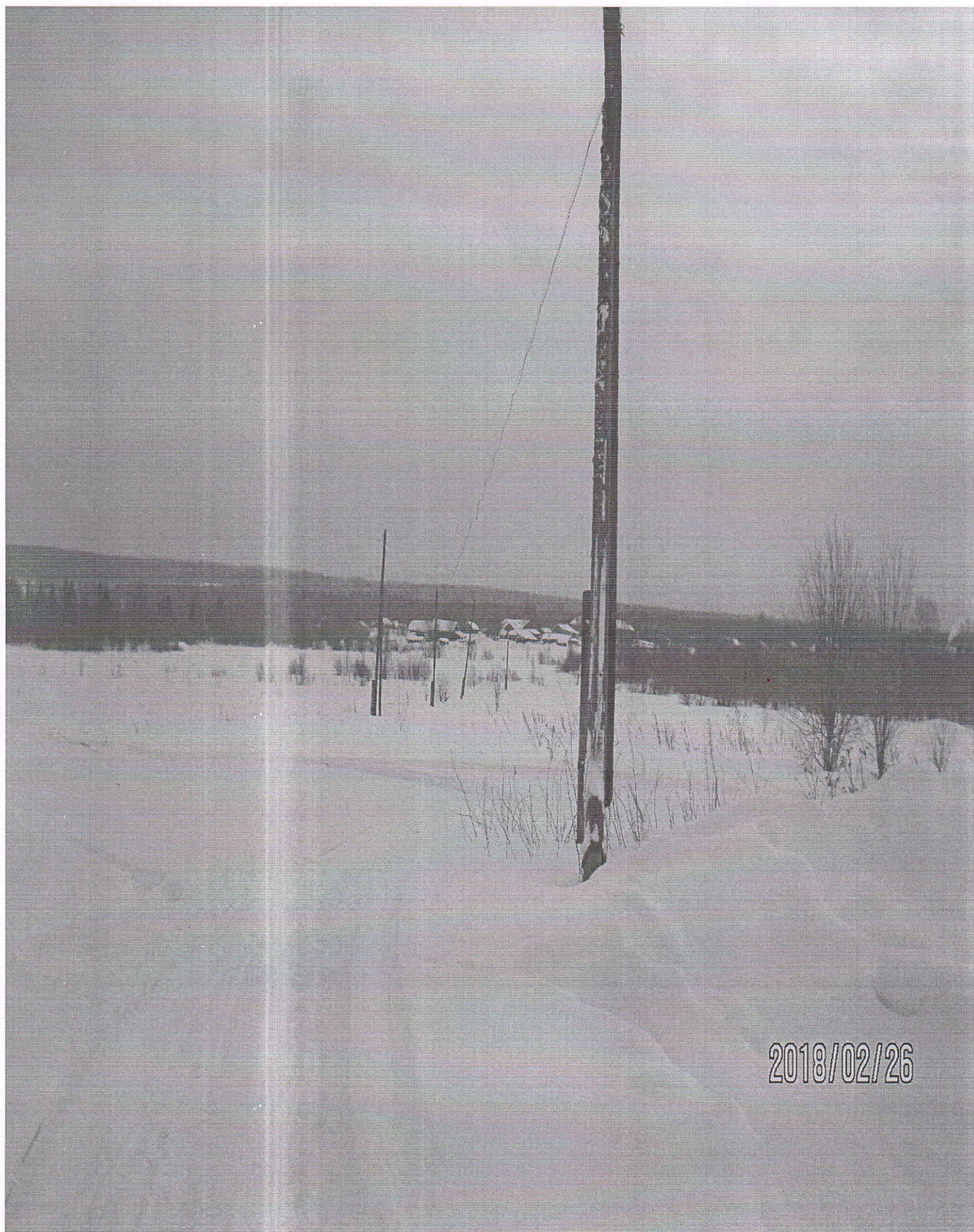
Устройство деревянного тротуара между улицами Пионерская и Колхозная в п. Ерцево, вдоль столбов линии электропередач.