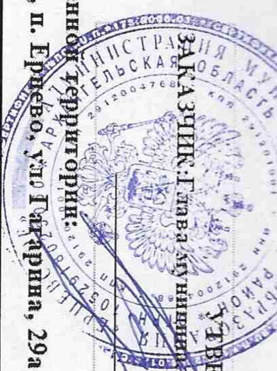
График выполнения работ по благоустройству муниципальной общественной территории (парк), расположенной по адресу: 164000, Архангельская область, Коношский район, п. Ершево, ул. Гадарина, 29а

УТВЕРЖДАЮ ЗАКАЗЧИК: Глава муниципального образования "Ершевское"