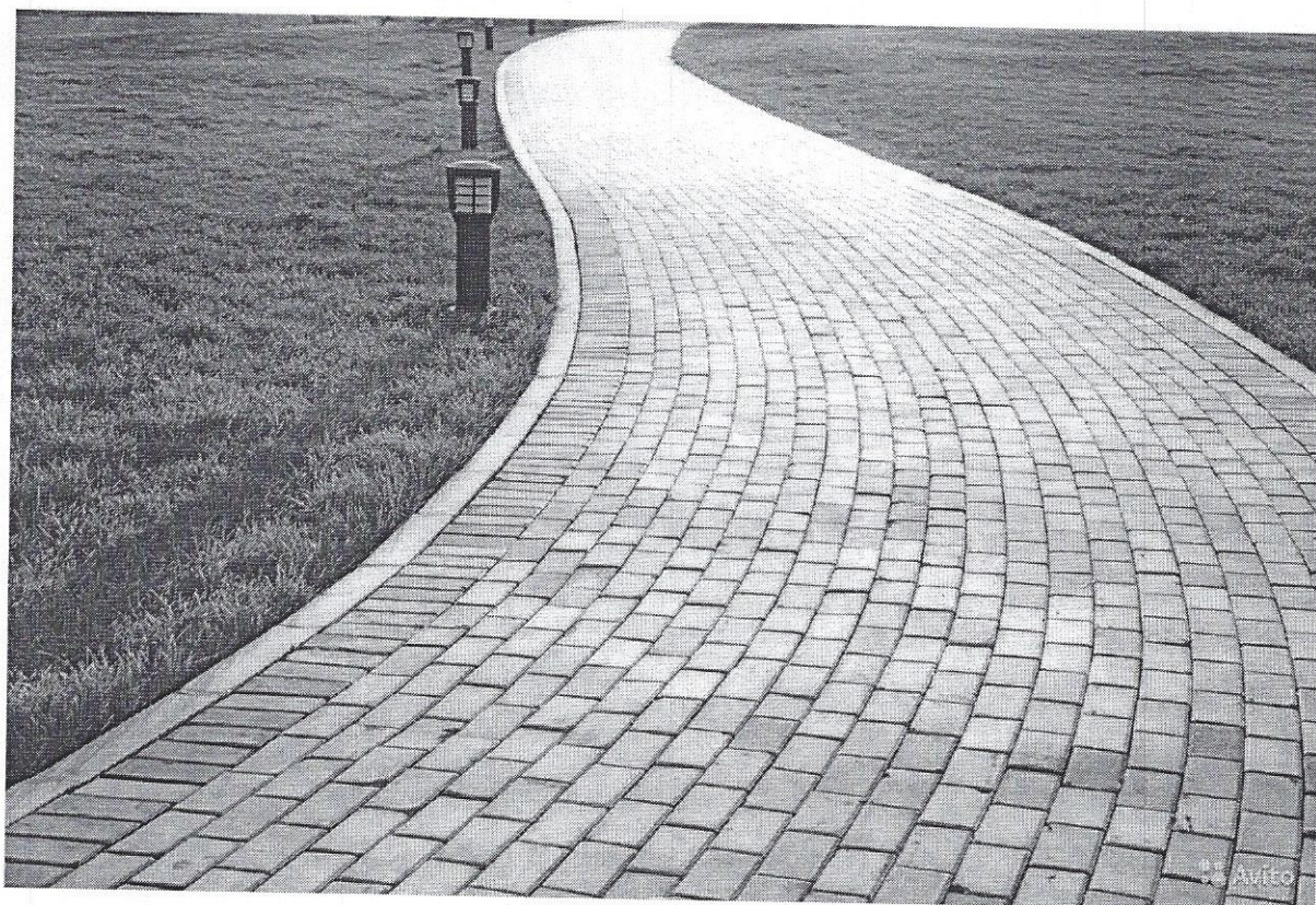
Схема ожидаемого результата