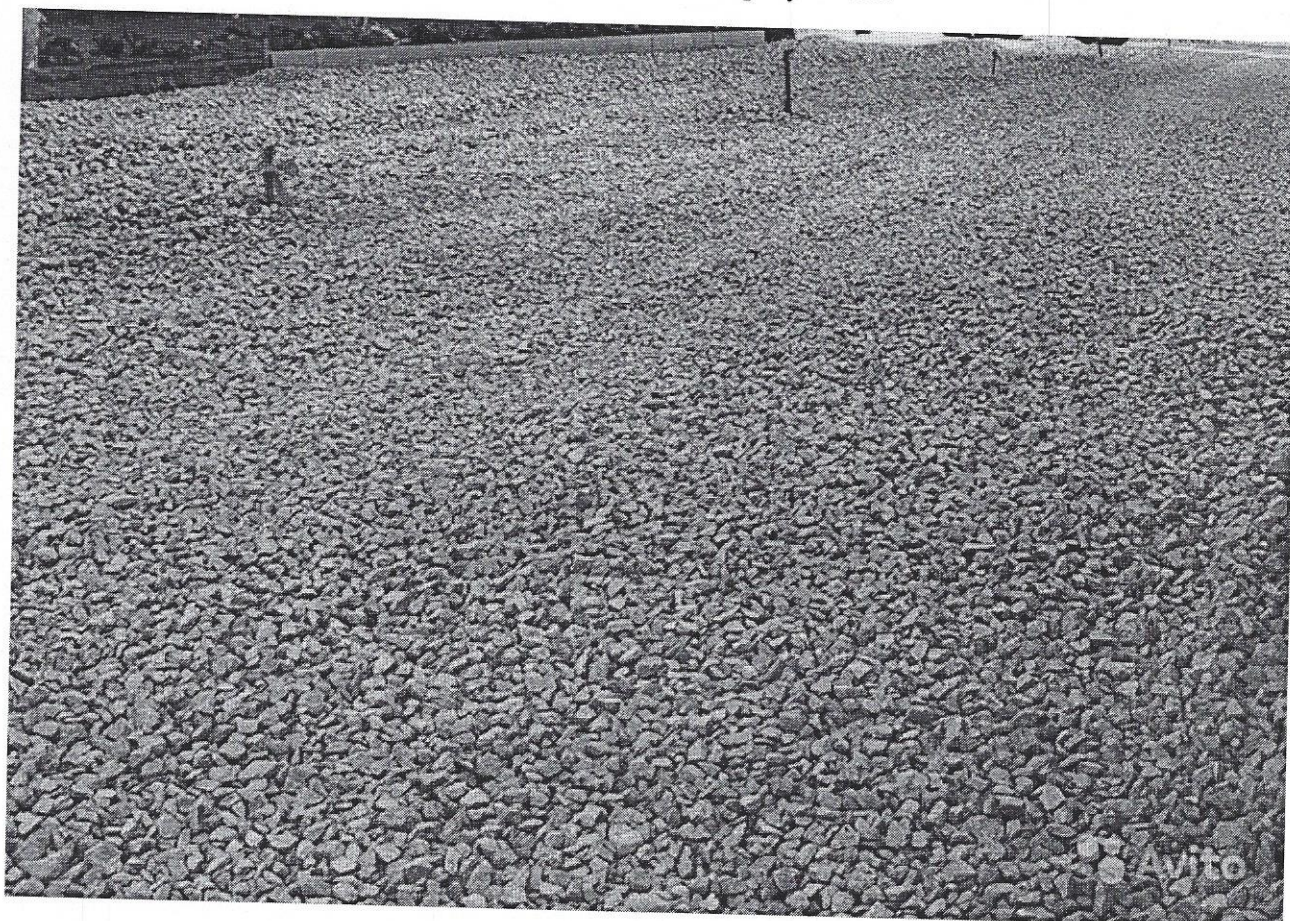
Схема ожидаемого результата